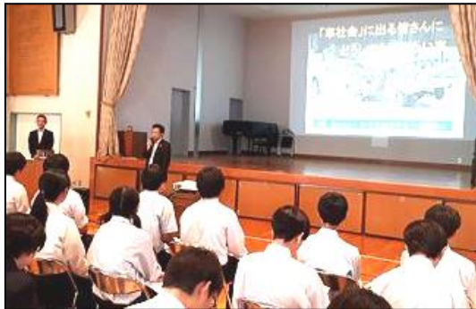
3学年 「講演(車社会に出る皆さんに)」