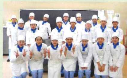
盛岡スコール高等学校 調理科 生徒の皆さん