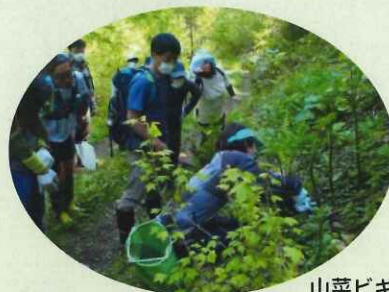
山菜ビギナー大歓迎！